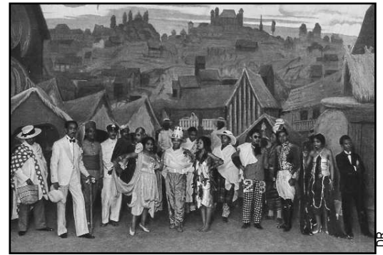
Scène finale au théâtre malgache