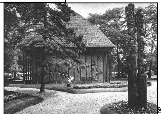
Un des pavillons de la section du Cameroun et du Togo