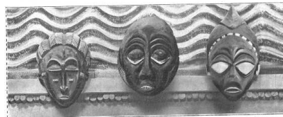
Masques de Côte d'Ivoire