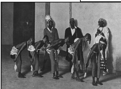
Danseuses de Siquiri (Guinée française)